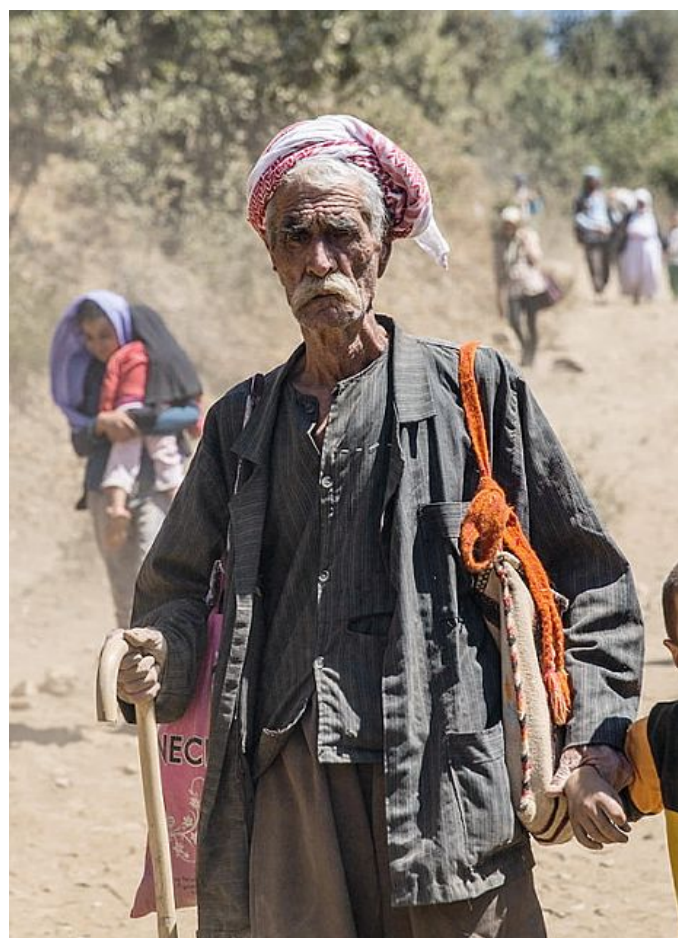
Un gruppo di curdi in fuga dall'Isis in Iraq: vittime dell'estremismo

È stato colpito un giornale, riferimento della libertà d'espressione. Ne è rimasto stupito?